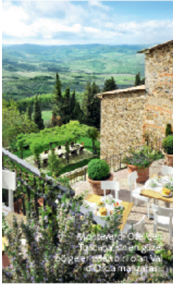
Monteverdi Otel, Castiglioncello'daki Toscana'nın en güzel doğasıyla bir arada Montepulciano'da.