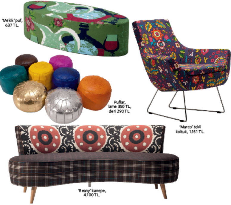
'Mekik' puf, 637 TL